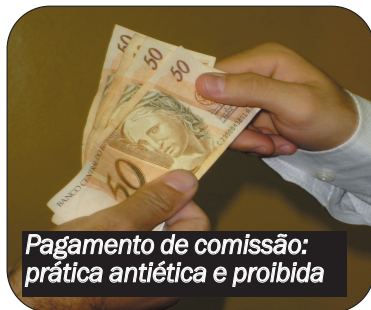
Pagamento de comissão: prática antiética e proibida

O presidente do Cremego abriu a reunião lendo a denúncia protocolada no Conselho. “Convidamos os representantes das clínicas radiológicas para, juntos, encontrarmos uma solução para prevenir essa grave infração ética”, explicou o presidente.